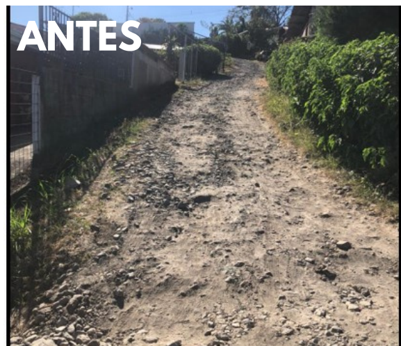
Calle Bolaños - Candalaria

El señor alcalde fue enfático en que la inversión en vías de comunicación es no solo necesaria, sino también importantísima para el desarrollo de la economía y turismo rural de Naranjo.